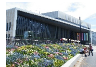
Musiktheater Linz - Ingeronius Prandner/2013

Beginn: 16:30 Uhr // Karten zum Preis von € 35,-- können ab sofort reserviert werden