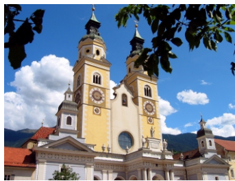
Brixen Dom Südtirol