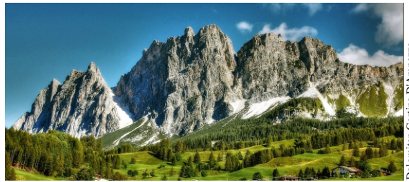
Dolomiten Cortina D'Ampezzo Südtirol