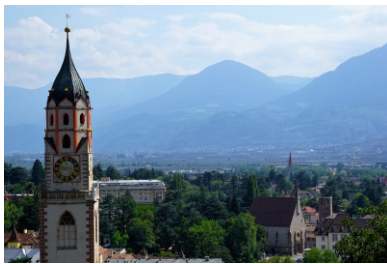
Meran Kirche Stadt Südtirol

Wir empfehlen eine Reiseversicherung zum Preis von € 49,-- pro Person im Doppelzimmer bzw. € 58,-- pro Person im Einzelzimmer