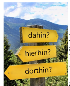
Wegweiser Landschaft beschreiben Fahrt ins Blaue

Leistungen: Busfahrt div. Besichtigungsprogramm Reiseversicherung vom Seniorenbund